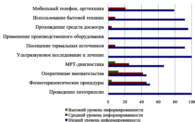
Рис. 1. Результаты информированности пациентов об особенностях безопасной жизнедеятельности (%) с впервые установленным ЭКС

кардиостимуляции ГБУЗ ТО «Областной клинической больницы № 1» г. Тюмени представлены на рис.1, 2.