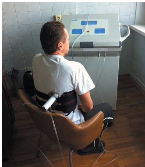
Рис. 1. Вид работающего прибора ВКВ-01